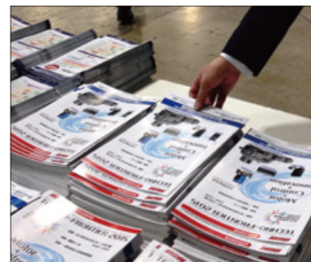
会場配布イメージ