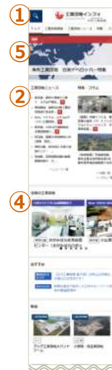
スマートフォン版