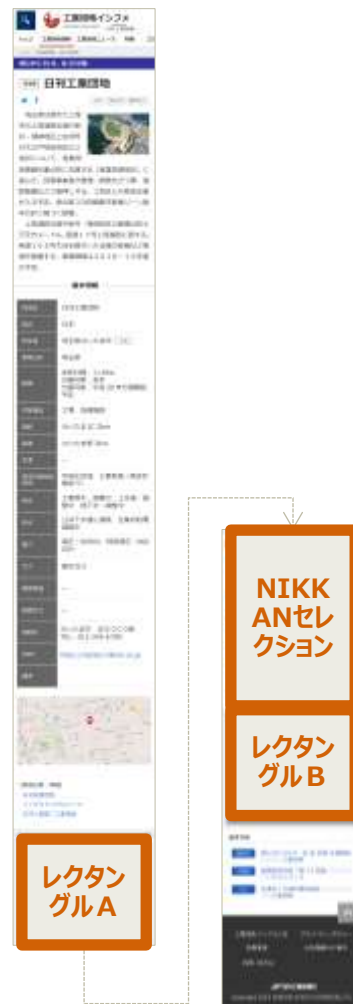
スペシャルコンテンツ